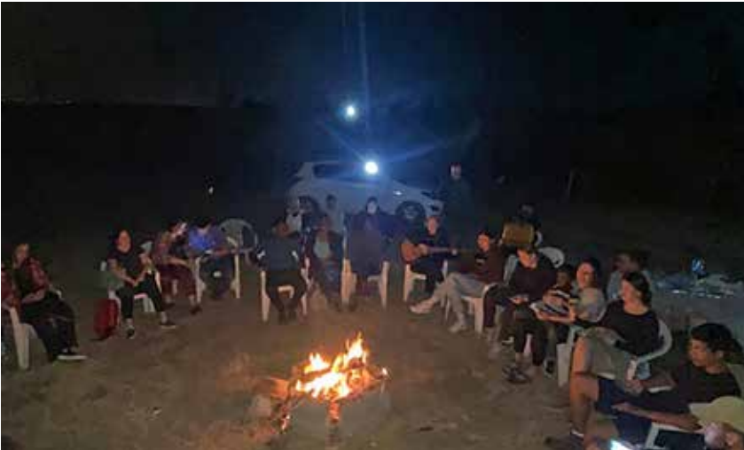
Lagerfeuer der Jugendgruppe

Der Dienst an israelischen Teenagern und ihren Familien war schon immer ein wichtiges Anliegen. Aber jetzt macht die kalte Realität des Krieges für Israel – das von allen Seiten von Feinden umgeben ist – unsere Arbeit für diese Familien noch dringlicher. Bitte beten Sie für unsere Vertreter in Israel, die dieser kriegsmüden Nation Hoffnung und das Licht des Messias bringen.