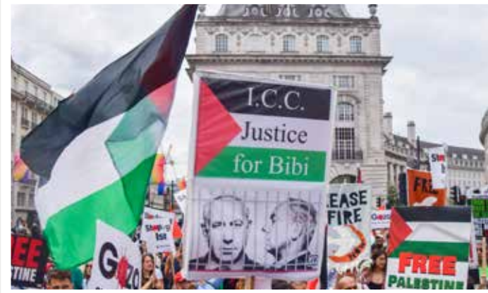
Demonstranten fordern, dass der IStGH Netanjahu inhaftiert.

Die jüngste Entscheidung des Internationalen Strafgerichtshofs (IStGH), Haftbefehle gegen den israelischen Premierminister Benjamin Netanjahu und den ehemaligen Verteidigungsminister Yoav Gallant wegen des Krieges im Gazastreifen zu erlassen, ist ein hinterhältiger Versuch, den jüdischen Staat daran zu hindern, sich gegen den islamischen Terrorismus zu verteidigen.