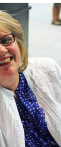
Steve und Alice